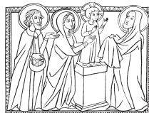
Portarono il bambino a Gerusalemme per presentarlo al Signore. LUCA 2,22