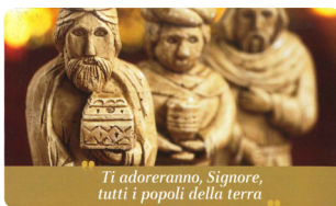
Ti adoreranno, Signore, tutti i popoli della terra