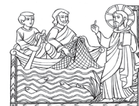
«Venite dicitur a me» Matteo 11,27