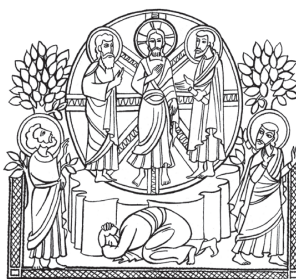
Apparve loro Elia con Mosè e conversavano con Gesù. Marco 9,4

ORE 18.00: fam. Zoccoletti e Facco; fam. Matterazzo e Cervaro