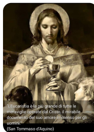
«L'Eucaristia è la più grande di tutte le memorie e il più grande dei sacramenti. Il suo dono è il dono del Signore, il dono del suo amore immenso per gli uomini.» (San Tommaso d'Aquino)