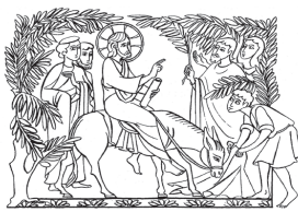
«Benedetto colui che viene nel nome del Signore!» Marco 11,9