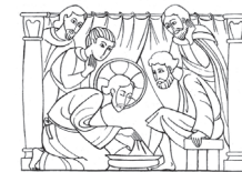
Cominciò a lavare i piedi dei discepoli. Giovanni 13,5

ORE 20.30: S. MESSA nella CENA del SIGNORE , e rito della lavanda dei piedi. Spoliazione altari e processione con il SS. Sacramento all'altare della Reposizione.