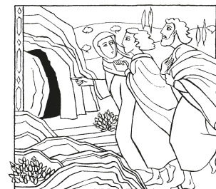
Pietro allora uscì insieme all'altro discepolo. Giovanni 20,3