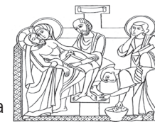
Preparò allora il corpo di Gesù e lo avvolsero con teli. Giovanni 19,40

ORE 21.00: VIA CRUCIS. Partiremo dal parco Piron-Ordan in via 8 marzo per raggiungere la parrocchiale, dove ci saranno la Benedizione e la venerazione della Croce di Cristo. Invitiamo le famiglie lungo il percorso, se possibile, a preparare le case illuminate. Colletta pro Terra Santa.