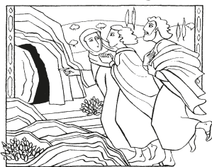
Pietro allora uscì insieme all'altro discepolo. Giovanni 20,3